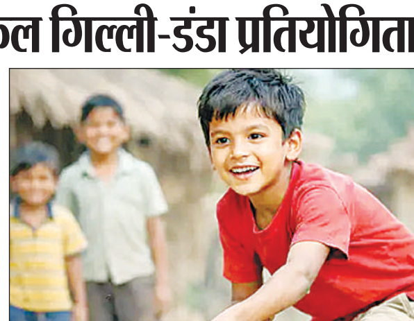
विजेता टीमों को मिलेंगे 21 हजार, 11 हजार और 5100 का नकद पुरस्कार

दैनिक रेवांचल टाइम्स, जबलपुर। देशी और पारंपरिक खेलों को बढ़ावा देने तथा युवाओं में खेल भावना विकसित करने के उद्देश्य से जिला पंचायत द्वारा जिला स्तरीय गिल्ली डंडा प्रतियोगिता का आयोजन किया जाएगा। यह प्रतियोगिता रविवार, 1 मार्च को सुबह 10:30 बजे से जवाहरलाल नेहरू कृषि विश्वविद्यालय के खेल परिसर में होगी। इस जिला स्तरीय प्रतियोगिता में जनपद स्तर पर आयोजित प्रतियोगिताओं की