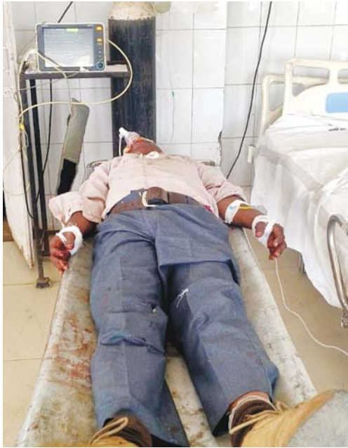
मौत के मुंह में धकेला जा रहा है। दीवारों पर जमी कालिख, लटकते तार और बिना चादर का वह टिडुरता लोहे का स्ट्रेचर-क्या यही है, मध्यप्रदेश सरकार व

जंग लगा स्ट्रेचर: जिस लोहे पर मरीज लेटा है, वह संक्रमण का सबसे बड़ा केंद्र है। क्या सीएमएचओ साहब बताएंगे कि मरीज को बचाने का प्रयास हो रहा है या उसे