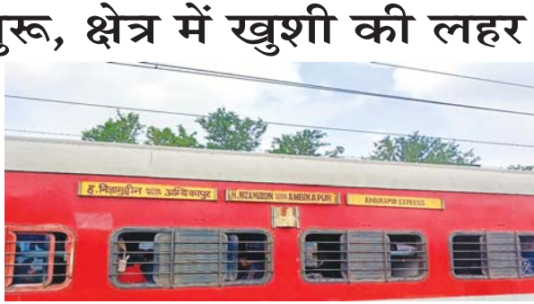
में रखते हुए रेल मंत्री अश्विनी वैष्णव ने कोतमा में इस प्रमुख ट्रेन के स्टॉपेज की आधिकारिक घोषणा की थी। रेल प्रशासन ने त्वरित कार्रवाई करते हुए 4 एवं 5 मार्च से इसकी समय सारणी भी घोषित कर दी थी, जिससे स्थानीय जनता में लंबे समय से बना संशय समाप्त हो गया। नगरवासियों को यह बड़ी सौभाग्य मिली है। बुधवार को पहले दिन जब निजामुद्दीन से चलकर अंबिकापुर जाने वाली एक्सप्रेस ट्रेन ने कोतमा में 2 मिनट

अनुपपुर। जिले के अंतर्गत कोतमा नगर और क्षेत्रीय निवासियों की वर्षों पुरानी मुराद आखिरकार पूरी हो गई है। यात्रियों की सुविधा को देखते हुए रेल मंत्रालय ने अंबिकापुर से निजामुद्दीन एवं वापसी में निजामुद्दीन से अंबिकापुर जाने वाली एक्सप्रेस ट्रेन का स्टॉपेज कोतमा रेलवे स्टेशन पर सुनिश्चित कर दिया है। बुधवार को पहली बार ट्रेन के यहाँ रुकने पर स्टेशन का नजारा उत्सव जैसा रहा, जहाँ नगरवासियों ने उत्साह के साथ इस नई शुरुआत का स्वागत किया। क्षेत्रीय रेल सुविधाओं के विस्तार और यात्रियों की समस्याओं को देखते हुए सांसद हिमादी सिंह निरंतर प्रयासरत थीं। उनकी विशेष मांग और जनभावनाओं को ध्यान