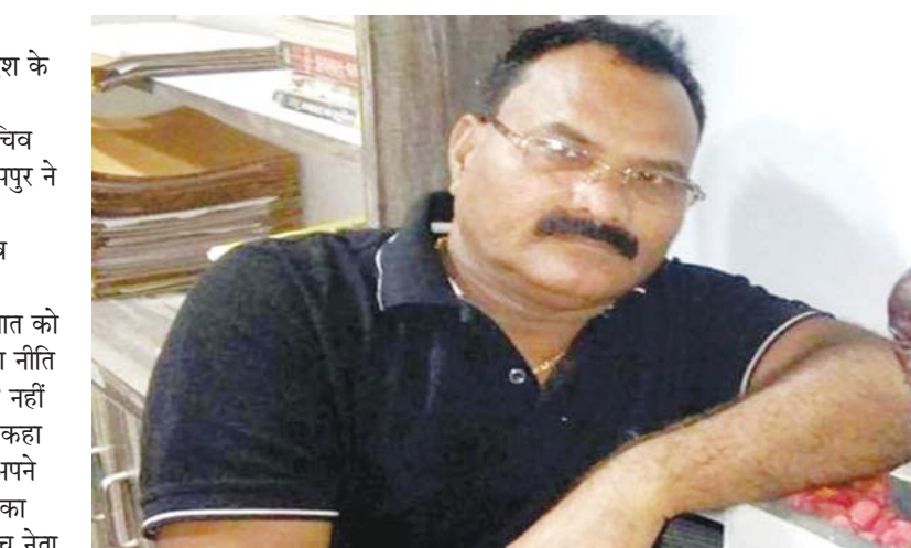
लोकतांत्रिक स्वतंत्रताओं और नागरिक स्वतंत्रताओं पर आलोचना करते आए हैं। लेकिन राजनीतिक असहमति कभी भी साम्राज्यवादी कसाइयों के हाथों किसी राज्य के संप्रभु प्रमुख को लक्षित हत्या को उचित या सामान्य नहीं ठहरा सकती। यदि ऐसे कृत्यों को स्वीकार कर लिया जाए, तो साम्राज्यवादी कानून अर्थहीन हो जाएगा