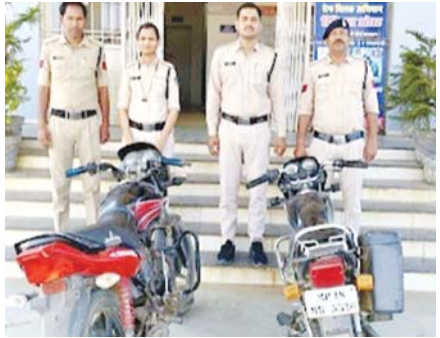
Beliya, Madhya Pradesh, India 67, Beliya, Madhya Pradesh 484334, India Lat 23.25048° Long 81.921553° Wednesday, 11/03/2026 10:36 AM GMT +05:30