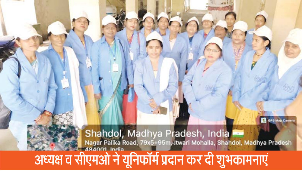
Shahdol, Madhya Pradesh, India Nagar Palika Road, 79x5+95m, Itwari Mohalla, Shahdol, Madhya Pradesh 484001, India