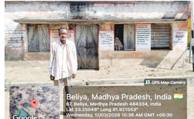
Beliya, Madhya Pradesh, India 67, Beliya, Madhya Pradesh 484334, India Lat 23.25048° Long 81.921553° Wednesday, 11/03/2026 10:36 AM GMT +05:30

दैनिक रेवांचल टाइम्स अनुपपुर। जिले के अंतर्गत आने वाले ग्राम बेलिया बड़ी में स्थित पशु अस्पताल विगत दो माह से बंद पड़ा है, जिससे आसपास के चार-पांच गांवों के किसानों को भारी परेशानी का सामना करना पड़ रहा है। तालाबंदी की वजह से बीमार पशुओं का इलाज नहीं हो पा रहा है, और किसान मजबूर होकर दवा व इलाज के लिए दूसरे गांवों में भटक रहे हैं। ग्रामीणों के अनुसार अस्पताल में डॉक्टर प्रभारी के रूप में तो हैं, लेकिन वे सिर्फ कामगारों पर ही सीमित हैं। वास्तविकता यह है कि पिछले दो महीनों से अस्पताल एक भी दिन नहीं खुला। यह कोई नई समस्या नहीं है, बल्कि वर्षों से यह अस्पताल इसी हालत में है। बावजूद इसके विभागीय अधिकारियों ने आज तक इस और कोई ध्यान नहीं दिया है। हाल ही में एक स्थानीय