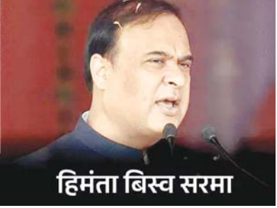
हिमंता बिस्व सरमा

नई दिल्ली। असम विधानसभा चुनाव के लिए भाजपा ने गुरुवार को अपने कैडिडेट्स की पहली लिस्ट जारी की। इसमें सीएम हिमंता बिस्व सरमा सहित 88 नाम हैं। हिमंता अपनी परंपरागत सीट जालुकबारी से चुनाव लड़ेंगी। वे सातवीं बार इस सीट से चुनाव लड़ रहे हैं। 25 दिन पहले भाजपा में आए पूर्व कांग्रेस अध्यक्ष भूपेन बोरा को भी टिकट दिया गया है। भाजपा ने एक दिन कांग्रेस छोड़कर पार्टी जॉइन करने वाले सांसद प्रद्युत बोरदोलोई को दिसपुर से उम्मीदवार बनाया गया है। इधर, प्रद्युत बोरदोलोई के इच्छा में शामिल होने के बाद उनके बेटे प्रतीक बोरदोलोई ने विधानसभा चुनाव में कांग्रेस उम्मीदवार के तौर पर चुनाव नहीं लड़ने का फैसला किया है। प्रतीक ने कांग्रेस अध्यक्ष मल्लिकार्जुन खड़गे को लिखे पत्र में कहा कि अब उनका कांग्रेस उम्मीदवार बने